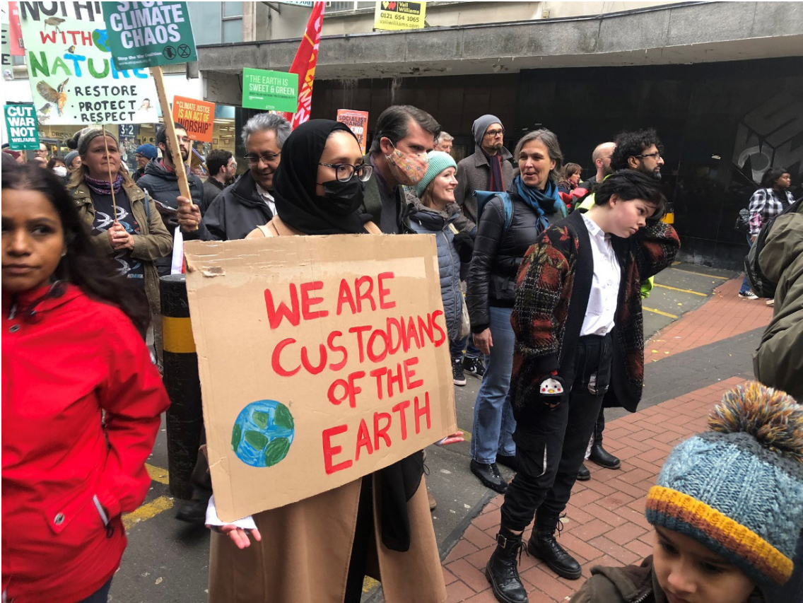
Fotoğraf 1. IFEES gönüllüleri İklim Adaleti kampanyasına katılım sağladı.

olmamasına rağmen, çevreci bakışın Müslümanlar arasında marjinal bir endişe olduğunu tespit eden araştırmalar mevcuttur (Hancock, 2018, s. 64). Bu tip çalışmalardan, Batı'da azınlık olarak yaşayan Müslümanların ülkelerindeki müesses çevre uygulamalarına destek olarak ve çevreciliğin İslam tarafından da destekleniyor olduğunu göstererek "yaşadıkları toplumda meşruiyetlerini yükseltmeye ve dini inançlarının farklılığına rağmen o ülkeye entegre olmakta başarılı olduklarına dikkat çekmeye çalıştıkları" tespitinde bulunulabilir (Keskin, 2022, s. 267). Müslümanların çoğunluk olduğu ülkelerde çevrecilik faaliyetlerine Batı'ya oranla daha mesafeli yaklaşılmasının temelinde yatan