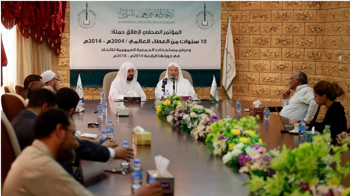
Fotoğraf 1. Uluslararası Müslüman Alimler Birliği ve Yusuf el-Karadavi

Karadavi Hoca'nın ilmî derinliği ve muhtelif ilim dallarındaki ihtisası ile beraber şu hususun altını da çizmek gerekmektedir: Peygamberler dışında kimse masum değil-